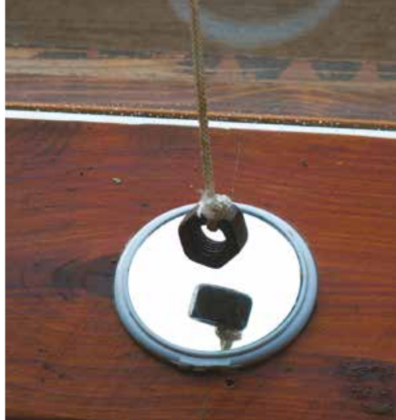
Specchio con filo a piombo.

Posizionamento della meridiana sul soffitto