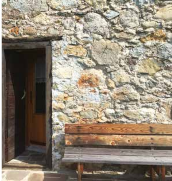
Mimetizzata nella parete di sasso

Il tutto in un'unica mattina aspettando l'ora di pranzo che in estate coincide con il mezzogiorno solare (le tredici e qualche minuto). In baita, infatti, "se disna co l'ora del Sol".