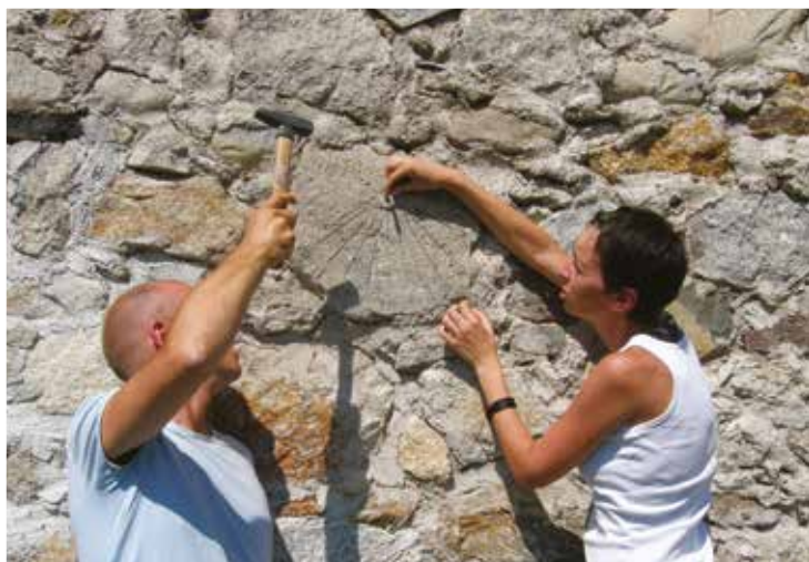
La figlia regola per burla l'orologio. Se sapesse che faccio così anch'io!

Viene chiamata Modigliani in quanto richiama le teste ritrovate nel 1984 nel fiume Arno e falsamente attribuite all'artista. A differenza di quelle... questa è un "Giongo" originale.